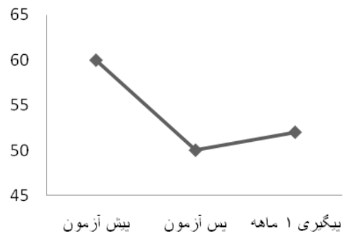
نمودار ۲) تغییرات نمره آزمودنی در شاخص GSI در مراحل پیش آزمون، پس آزمون و پیگیری

کل پاسخ‌های داده شده محاسبه کردیم و در مرحله بعد نمره به دست آمده را بر اساس نمره هنجاری گروه بیماران روان‌پزشکی سرپایی استاندارد کردیم و نمره استاندارد شده در مراحل پیش آزمون، پس آزمون و دوره پیگیری را با هم مقایسه کردیم که نتایج آن در نمودار ۲ ارائه شده است.