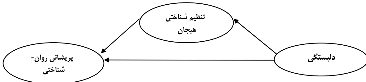
نمودار (۱) مدل مفهومی پژوهش

مورد مطالعه قرار گرفته‌است و نقش مکانیسم‌های واسطه-ای مؤثر بر این رابطه بررسی نگردیده‌است. با عنایت به وابسته به فرهنگ بودن سازه دل‌بستگی (۳۶) و احتمال دستیابی به نتایج مختلف در نمونه‌ها و فرهنگ‌های متفاوت در مطالعه این متغیر و با توجه آن‌چه از نظر گذرانده‌شد،